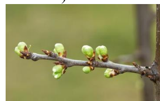
buton verde prun