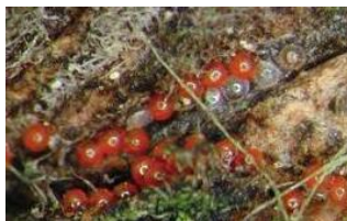
păianjenul roșu- Panonychus u.- ouă