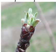
urechiușe de șoarece