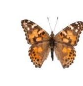
fluturile cărămizii - atac larva